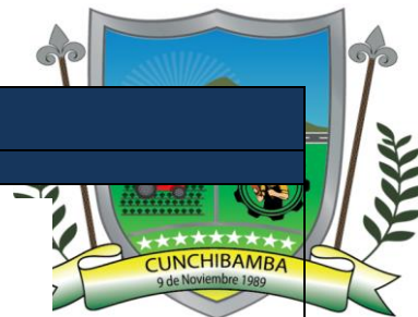
Imagen 27 Orgánico funcional Gobierno Autónomo Descentralizado Cunchibamba